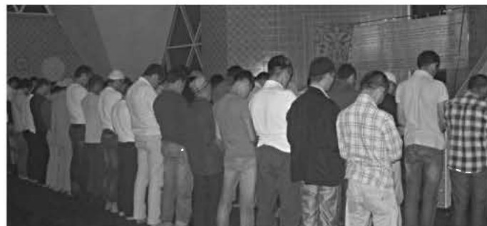
Ифтар в мечети "Аляя-Тюльпан", 12 августа