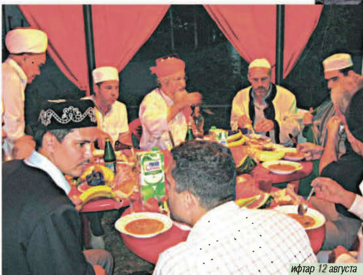
ифтар 12 августа