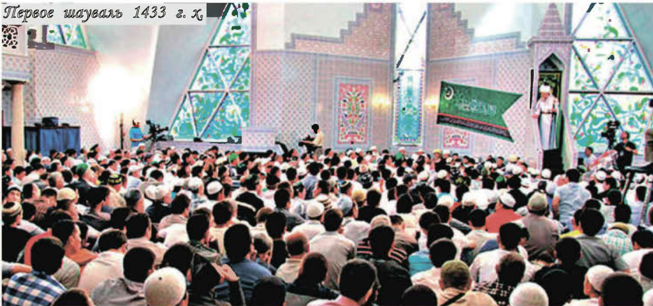
Празднование Ураза-Байрам в уфимской Соборной мечети «Ляля-Тюльпан» 19 августа 2012 года